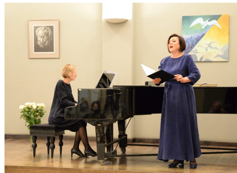
Koncertavo solistė Rita Preikšaitė